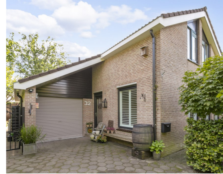
Mgr. Van Dongenlaan 32 Hoeven