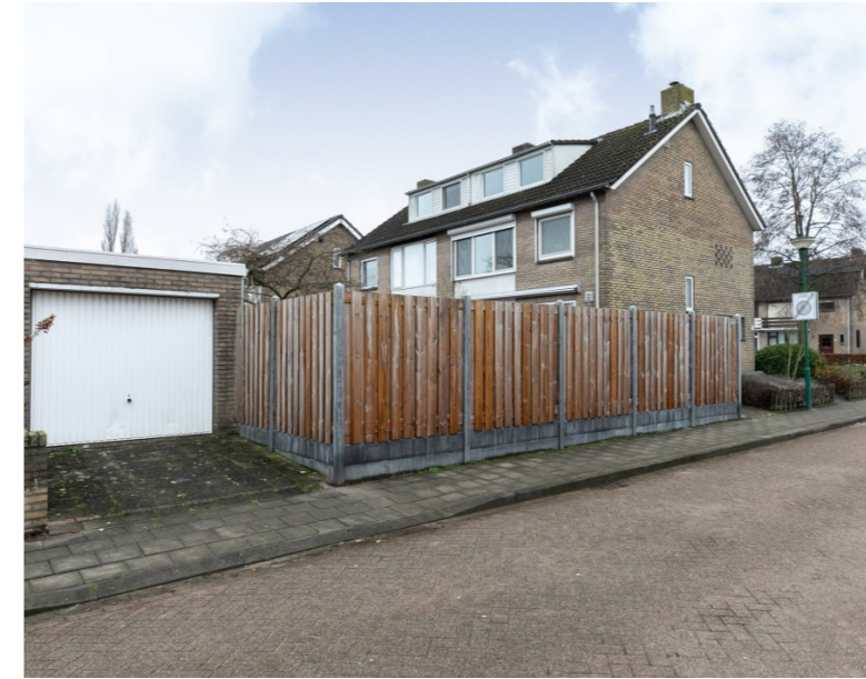
Hoefakker 27 Chaam