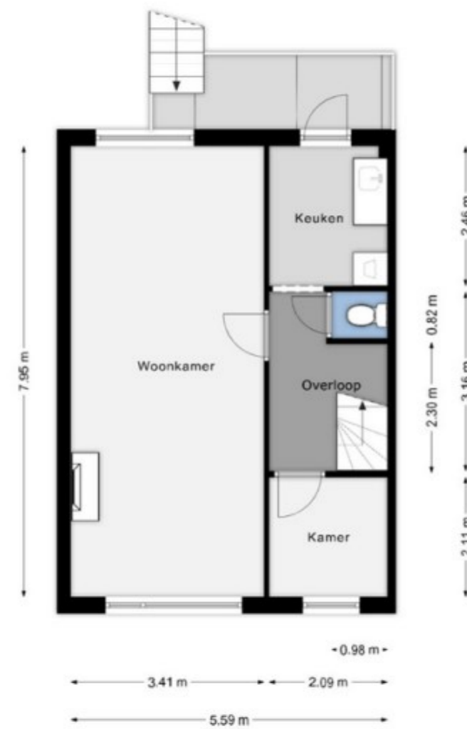
Bovenwoning - eerste verdieping