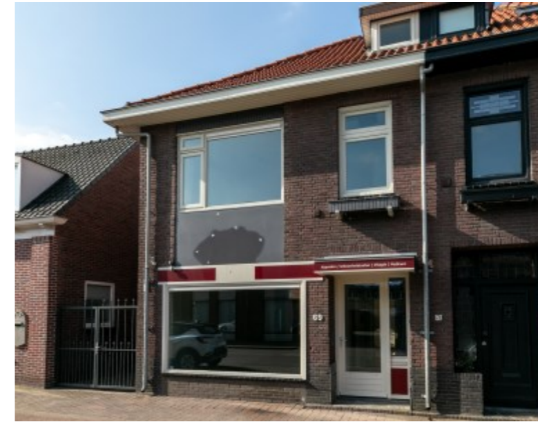
Sint Bavostraat 69 Rijsbergen